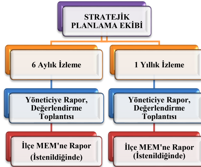
Şekil 4. Stratejik Plan İzleme ve Değerlendirme Modeli

Okulumuzun 2024-2028 Stratejik Planı İzleme ve Değerlendirme sürecini ifade eden İzleme ve Değerlendirme Modeli hazırlanmıştır. Bu model, Milli Eğitim Bakanlığının izleme ve değerlendirme modeli esas alınarak hazırlanmıştır. Müdürlüğümüzün Stratejik Plan İzleme-Değerlendirme çalışmaları eğitim-öğretim yılı çalışma takvimi de dikkate alınarak 6 aylık ve 1 yıllık sürelerde gerçekleştirilecektir. 6 aylık sürelerde Üst Yöneticiye rapor hazırlanacak ve değerlendirme toplantısı düzenlenecektir. İzleme-değerlendirme raporu, istenildiğinde Stratejik Geliştirme Başkanlığına gönderilecektir. Okulumuz Stratejik Planı izleme ve değerlendirme çalışmalarında 5 yıllık Stratejik Planın izlenmesi ve 1 yıllık gelişim planının izlenmesi olarak ikili bir ayrıma gidilecektir. Stratejik planın izlenmesinde 6 aylık dönemlerde izleme yapılacak denetim birimleri, il ve ilçe millî eğitim müdürlüğü ve Bakanlık denetim ve kontrollerine hazır halde tutulacaktır. Yıllık planın uygulanmasında yürütme ekipleri ve eylem sorumlularıyla aylık ilerleme toplantıları yapılacaktır. Toplantıda bir önceki ayda yapılanlar ve bir sonraki ayda yapılacaklar görüşülüp karara bağlanacaktır.