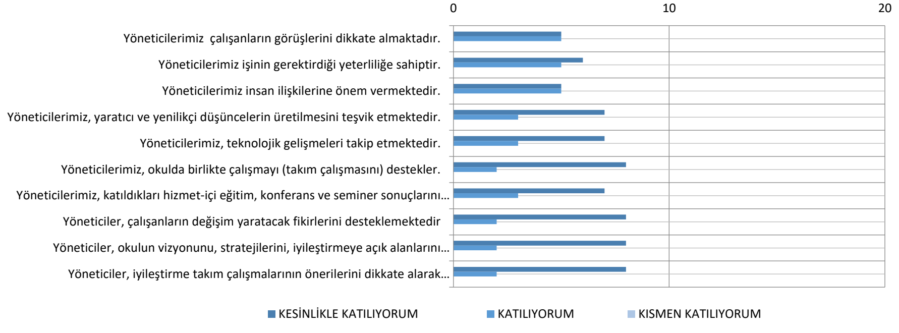
Şekil 1. Yönetici, Öğretmen ve Personel İç Paydaş Anket Sonuçları-1

Sizlere daha kaliteli hizmet verebilmek için okulda uygulamalarla ilgili görüşlerinize ihtiyaç duyulmaktadır. Tüm soruları eksiksiz ve samimiyetle doldurmanızı rica eder, katılımınıza teşekkür ederiz.